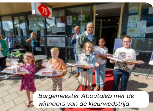
Burgemeester Aboutaleb met de winnaars van de kleurwedstrijd.

Voor de kleinere kinderen was er een kleurwedstrijd. De vijf kinderen met de mooiste kleurplaat kregen van burgemeester Aboutaleb een groot kleurpakket. De Hoekse brandweer was aanwezig en kinderen konden een kijkje nemen in een brandweerauto. Ook konden kinderen in een politieauto of op een