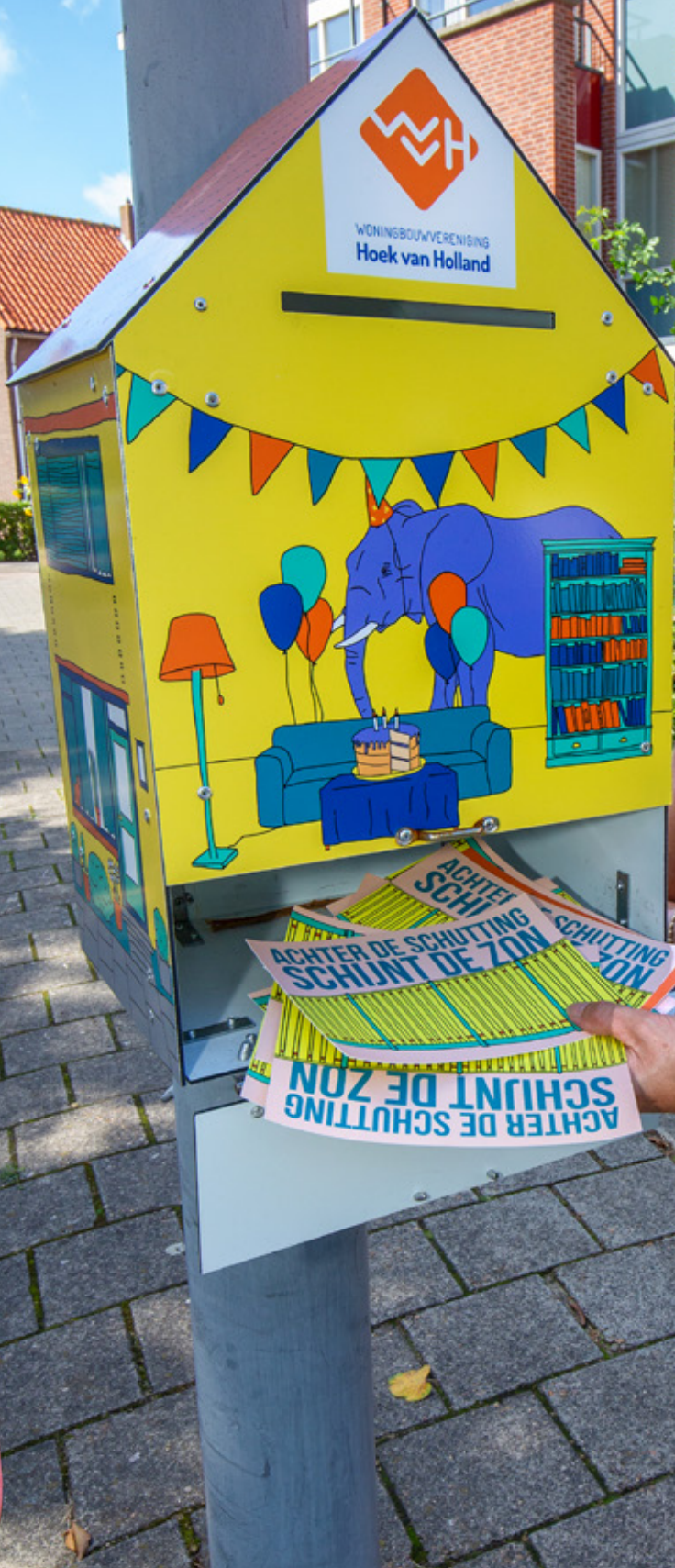
Antoinette Izeboud bij de brievenbus.

“Elke twee weken kregen de bewoners een kaart, een halfjaar lang”